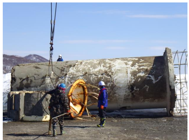
保管場所での仮置き状況