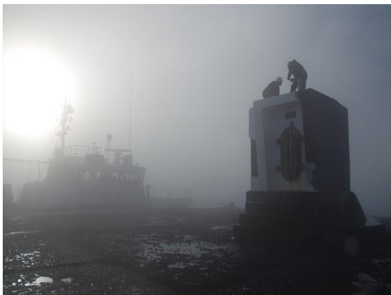
けあらしの中での作業状況

灯 質 群せん緑光 毎6秒に2せん光 光達距離 3海里（約5.5km） 高 さ 平均水面から6.3メートル 灯塔機器 鉄造、円筒型、LED式灯器