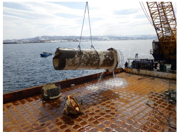
灯塔部分の引き揚げ状況