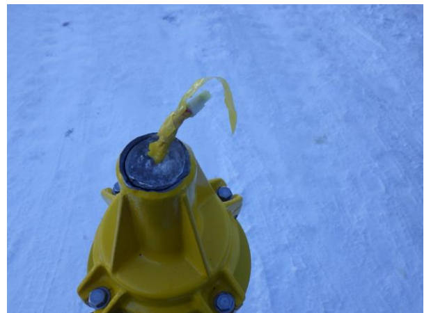
波によりちぎれた仮灯の破断面