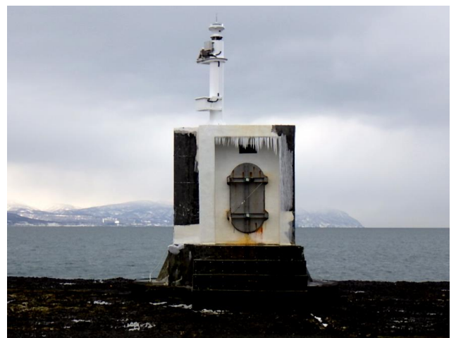
従前設置の仮灯（前） ⇒ ⇒ ⇒ 本日設置した仮設灯台（後）