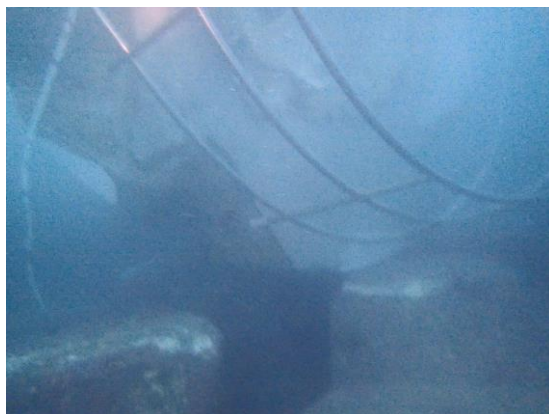
※平成30年1月9日（第3報）発表時の海没状況の写真