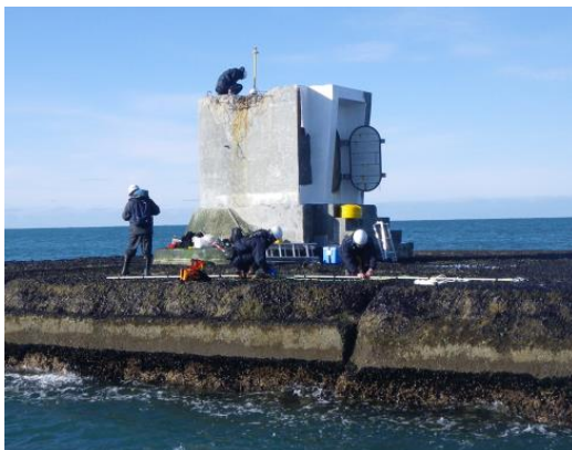
（倒壊した灯台の捜索及び仮灯設置状況）

灯 質 単せん黄光 毎4秒に1閃光 光達距離 2.3海里（約4.4km） 高 さ 堤上から頂部 約5メートル 灯塔機器 鉄製ポール型、LED式灯器