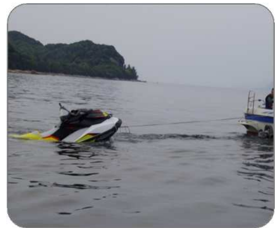
<参考> 事故を起し航行不能となり、曳航救助される水上オートバイ