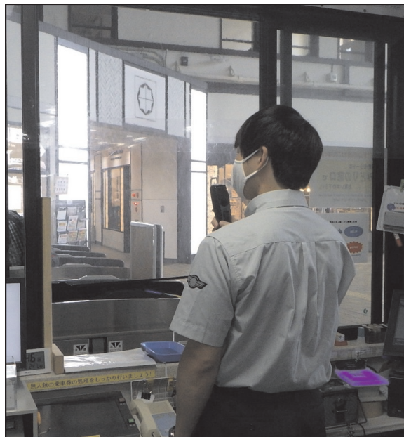
小樽駅構内でアナウンスしている様子

小樽海上保安部では、海水浴時の遊泳事故を防ぐため、JR 北海道の協力を得て、駅構内や列車内でのアナウンスにより事故防止を呼びかけています！海水浴場以外での遊泳は重大な事故に繋がるおそれがあります。遊泳は、開設された海水浴場を利用しましょう！ https://www6.kaiho.mlit.go.jp/watersafety/