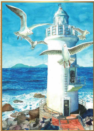
2019 海上保安庁長官賞