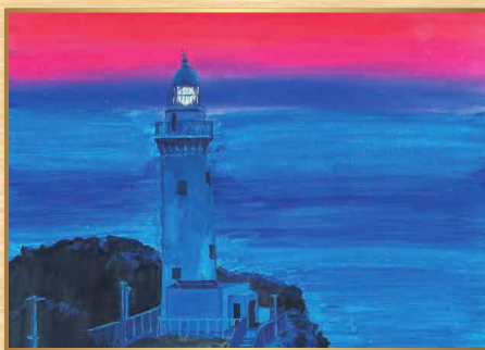
2019 小学生高学年金賞