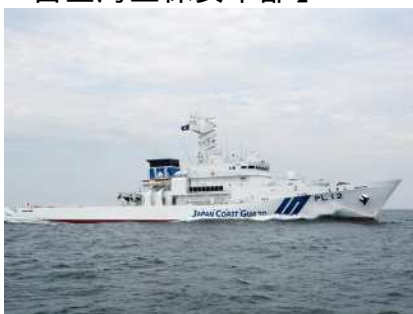
巡視船えさん（小樽海上保安部所属） 総トン数 1500トン