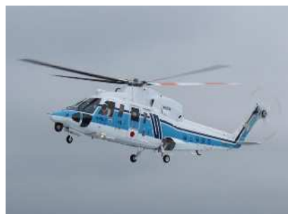
シコルスキー76C（釧路航空基地所属） 愛称：しまふくろう