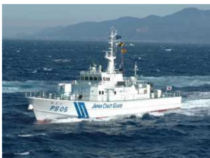
巡視船かむい（江差海上保安署所属） 総トン数 195トン