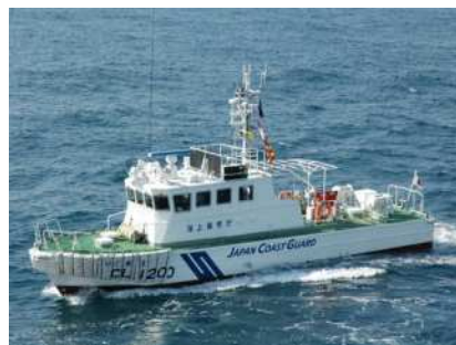
巡視船やぐるま（小樽海上保安部所属） 総トン数 26トン