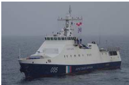
警備艇コーラル（サハリン州国境警備局所属） 総トン数630トン