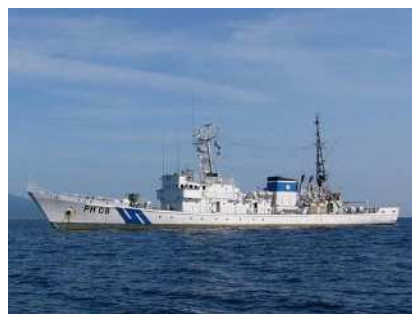
巡視船ちとせ（留萌海上保安部所属） 総トン数 325トン