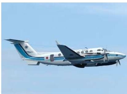
ビーチ350（千歳航空基地所属） 愛称：えとぴりか