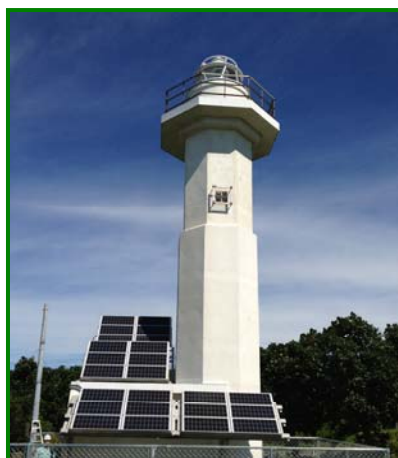
日高門別灯台 (本年9月 太陽電池化)