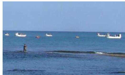
船釣りの人も陸釣りの人も事故にご用心

8月の海難隻数及び海難による 死者・行方不明者数(速報値) 19隻、0名 平成23年累計(速報値) 87隻、6名